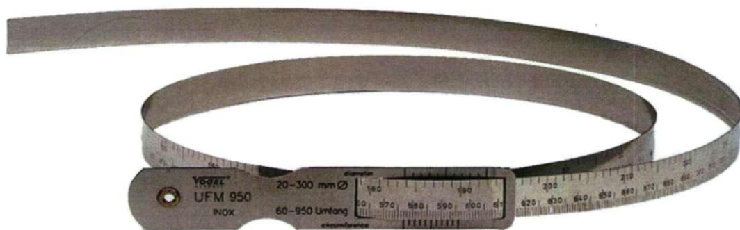
Рисунок 1 – Циркометр для измерения наружных диаметров и длин окружностей UFM

Внешний вид циркометров UFM представлен на рисунке 1. Циркометры для измерения наружных диаметров и длин окружностей UFM накладывают на измеряемый объект, так чтобы лента циркометра опоясывала его. Ленту циркометра продевают в округлое отверстие на накладке и направляют в узкое отверстие на накладке, затягивая ленту до упора. Отсчет показаний производится по шкале.